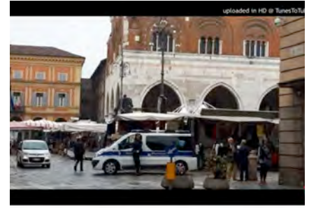
ce dei Piacentini. Negozi chiusi la domenica, favorevoli o contrari